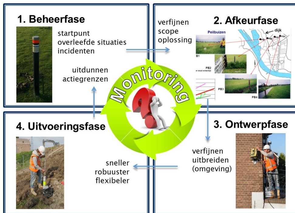
Figuur 1: Monitoring in de verschillende levensfasen van de dijk

Figuur 1 geeft een eerste raamwerk met 4 levensfasen van de dijk en/of het dijkversterkingsproject: beheerfase (inclusief toetsing), afkeurfase (inclusief vaststellen scope), ontwerpfase en uitvoeringsfase. In de figuur is aangegeven wat het nut van eerder monitoren in een beschouwde fase kan zijn voor een volgende fase.